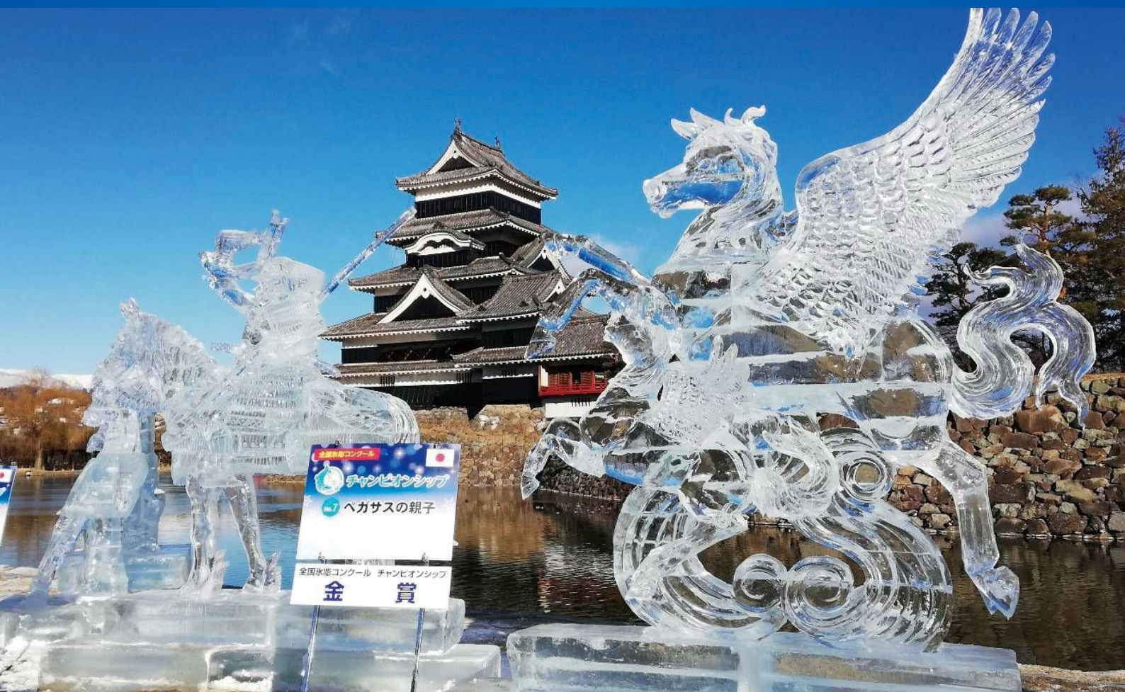
松本氷彫フェスティバル